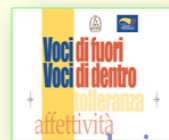
Laboratorio sociale dell'I.P.M. di Treviso