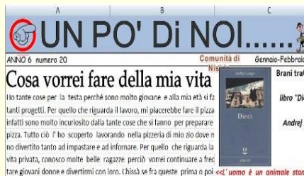
Giornalino dell'I.P.M. di Quartucciu

L'Archivio Multimediale costituisce una memoria ed un "osservatorio" permanente e privilegiato delle attività e dei progetti artistici e creativi multimediali prodotti dalla rete dei servizi minorili.