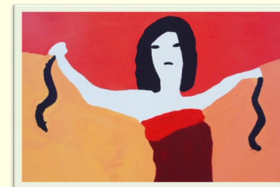
Laboratorio artistico dell'I.P.M. di Nisida